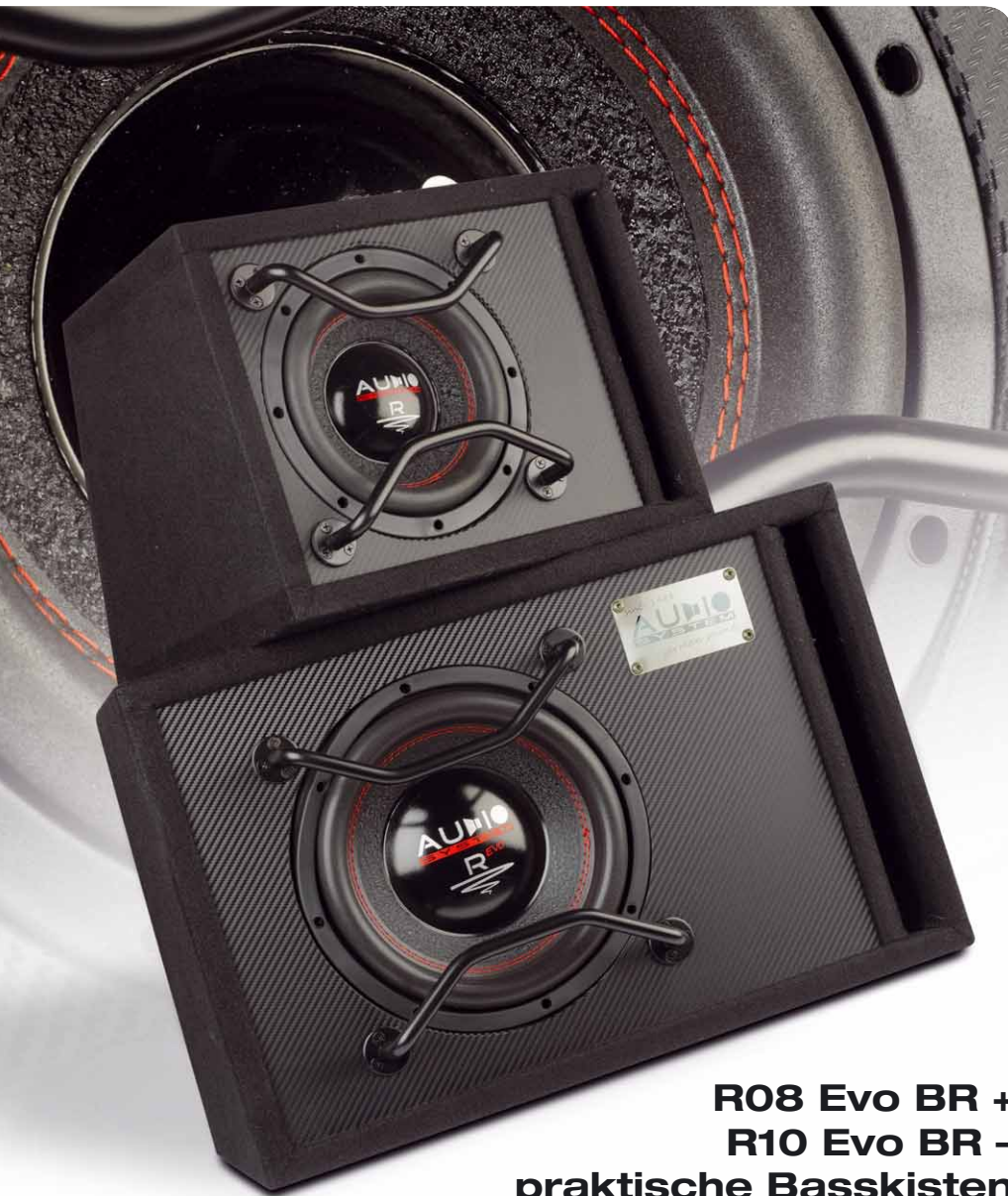
R08 Evo BR + R10 Evo BR – praktische Basskisten von Audio System